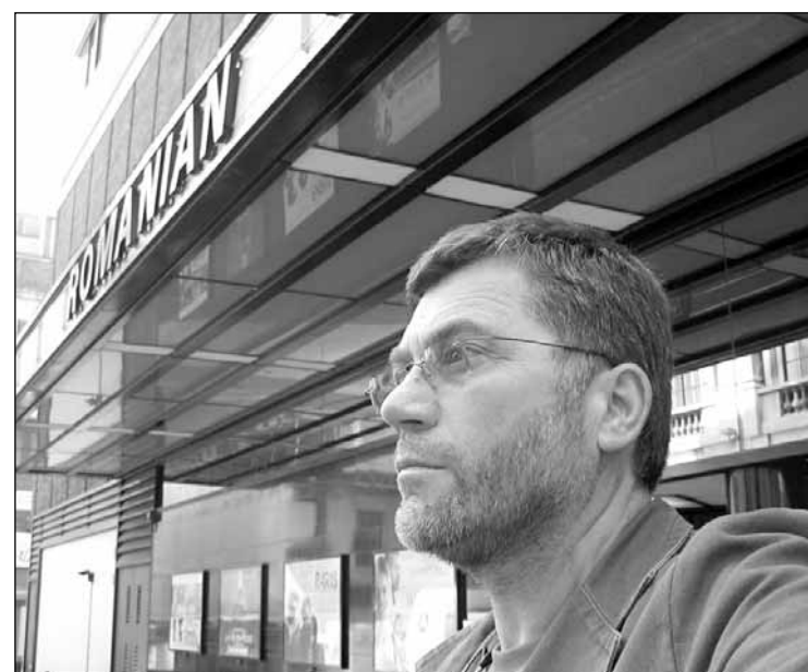
Autopotret cu Curzon Myfair Cinema