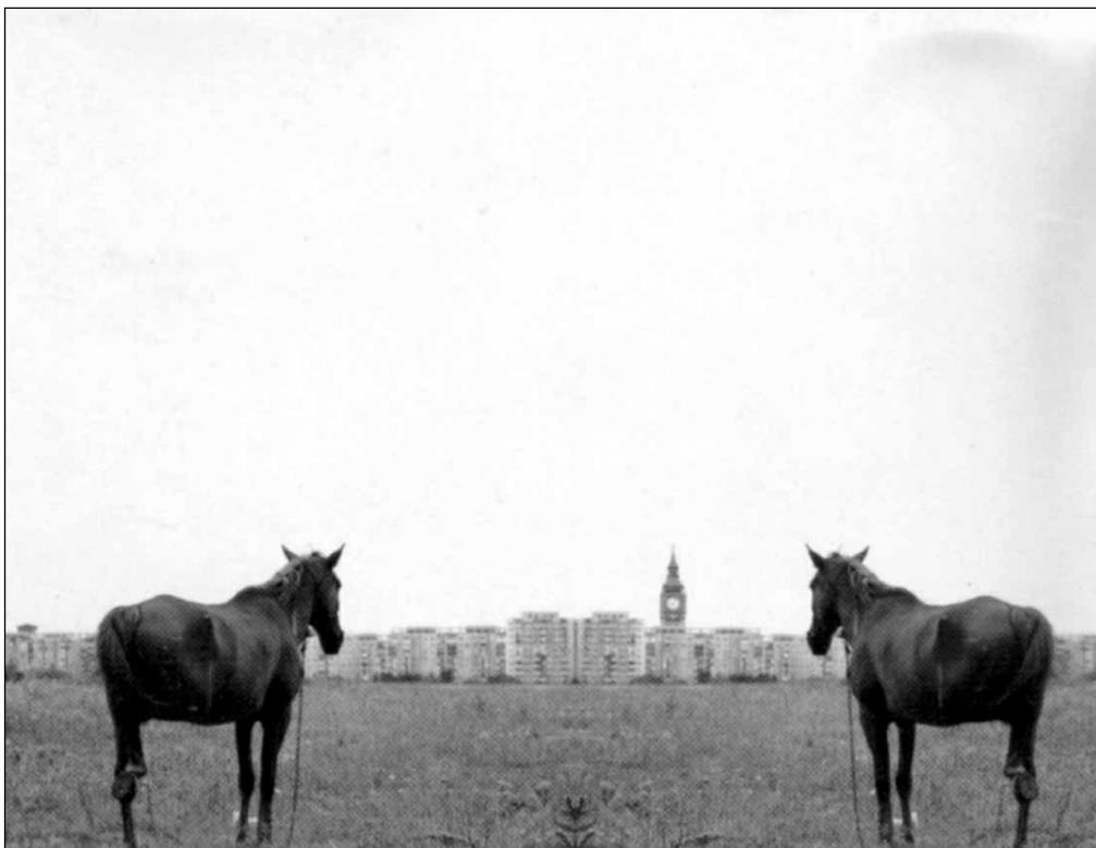
Flyerul festivalului, față

Desfășurată sub logo-ul „Trecut imperfect, viitor continuu“, cea de-a patra ediție a Festivalului a fost un succes... normal, care mă consolează de proasta prestație (și în lume) a politrucilor noștri, uneori – nu e cazul Londrei, din fericire – și a diplomaților noștri. Ediția a patra am spus? Dar deja încep pregătirile pentru ediția a cincea. Iată, începem să instaurăm o tradiție în țara tuturor tradițiilor.